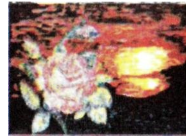
Pintura Prisioneros Tupacamaristas.