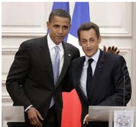
Obama y Sarkozy, genocidas imperialistas

E n el norte de África están sucediendo una serie de acontecimientos que desde los medios de comunicación acuñaron como la “construcción de un nuevo mundo”, otros más los han denominado como, “las revoluciones Jazmín”, poniendo énfasis en aspecto espontaneo inducido a través de las redes sociales en la gran lucha por la democracia sin adjetivo alguno. Destacando hasta el hastío el carácter espontaneo de las masas que no requieren la intervención de una dirección política y militar, que de orden, estructura y dirección al proceso en cuestión.