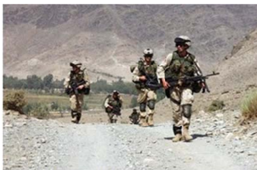
Militares del ejército estadounidense

Ha puesto a disposición del mejor postor las armas que producen: a los “salvadores de la democracia” cuando ésta está en riesgo según sus parámetros y a los rebeldes que luchan por la democracia cuando existe un régimen autocrático, autoritario, dictadura. Pero, también ha armado hasta los dientes y estimulado la fabricación de armamento sofisticado a los llamados terroristas fundamentalistas a pesar de que atenten contra “países democráticos”.