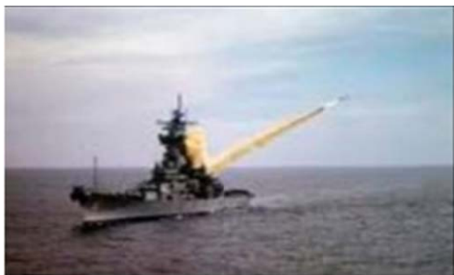
Fuerzas imperialistas masacrando al pueblo libio

Por la propia evolución de los acontecimientos hoy se ha desnudado una realidad manifiesta con mucha anticipación, pero que se mantuvo oculta por una cortina mediática auspiciada y dirigida por el imperialismo norteamericano, en complicidad con sus aliados europeos y sus lacayos en el Medio oriente. Esta realidad evidencia las pretensiones del imperialismo que van más allá de Libia y son de carácter geopolíticas, circunscritas a la lucha por la dominación económica, política, ideológica y militar en el marco del interminable reparto del mundo entre las potencias imperialistas.