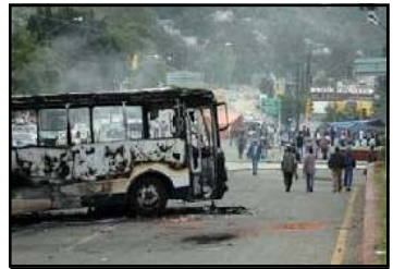
La respuesta del movimiento popular oaxaqueño no se hizo esperar, y fue firme.

son medios de comunicación inútiles de por sí, sino que el contenido que han llegado a adquirir se debe a la posición de clase de sus propietarios, los industriales de la telecomunicación, la burguesía de los medios de comunicación.