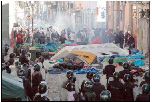
Intento de desalojo por parte de las fuerzas represivas del gobierno de Oaxaca, a mediados de junio de este año, en contra del movimiento magisterial.

indignación, el coraje de los mas desposeídos, de los siempre ninguneados, de los olvidados.