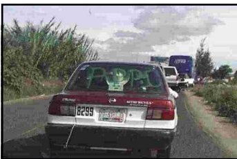
Las pintas de la APPO dan un colorido muy peculiar a los taxis de la ciudad de Oaxaca.

Fundamentalmente los grandes negocios que se concretan en el marco del Plan Puebla-Panamá, específicamente en las regiones Istmo y Sierra Sur.