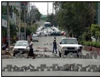
Aspecto de algunas de los cientos de barricadas que hay en la ciudad de Oaxaca.

La noche llegó y cientos de luminarias cubrieron la capital oaxaqueña. Las principales avenidas de la ciudad, Av. Ferrocarril, Camino Nacional, Periférico, etcétera se iluminaron con la luz tenue de las fogatas y llantas