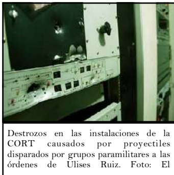
Destrozos en las instalaciones de la CORT causados por proyectiles disparados por grupos paramilitares a las órdenes de Ulises Ruiz.