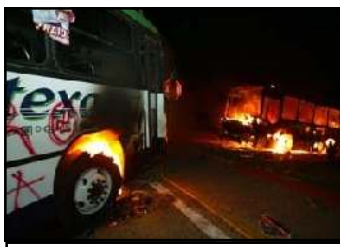
La respuesta del movimiento popular oaxaqueño no se hizo esperar, y fue firme.

incendiadas. Decenas de barricadas, grandes y pequeñas, cubrieron escalonadamente las entradas de Oaxaca. El movimiento popular-magisterial comprendió bien que no debe ocurrir un sitio de luchadores sociales como sucedió en San Salvador Atenco, Estado de México, y entonces amplió el territorio a defender: la ciudad de Oaxaca, completita. Las barricadas deberán servir de algo para evitar la entrada de vehículos pesados. Si las fuerzas represivas de Ulises Ruiz quieren entrar deberán hacerlo a pie. Por eso es obvio que los cuerpos represivos del estado no entren sino a balazos. Como grandes cobardes que son, echan por delante las balas. Sus pechos, por otro lado, los protegen con escudos antibalas. No vaya a suceder que un argumento contundente les perforé el pecho.