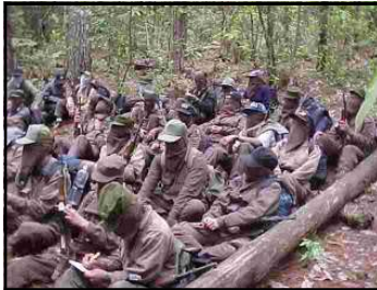
Campamento revolucionario de las FARP. Estos campamentos son auténticas escuelas político-militares, donde se da una formación integral a los combatientes de la revolución, para que comprendan la necesidad de desarrollar un trabajo serio, metódico y callado, en contraposición al protagonismo de los grupos pseudo revolucionarios.

cuando se emplea la táctica guerrillera, ya sea para luchar políticamente o en su defecto para realizar acciones militares.