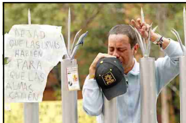
¿Desilusión? ¿Rabia? ¿Impotencia? Un integrante de la resistencia popular contra el fraude electoral llora afuera del TRIFE.

anteriormente es ser ilusos e ingenuos, para derrotarlos hay que enfrentarlos por medio de la lucha política en todas sus formas de lo contrario te avasallan seas quien seas.