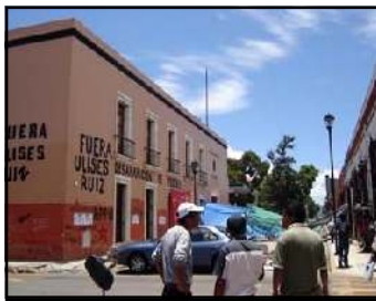
Todo el pueblo de Oaxaca ya sólo clama una cosa: la renuncia del genocida Ulises Ruiz Ortiz.

de la oscuridad nocturna, las comisiones de guardia empezaron a prepararse. A través de la radio, se solicitó el apoyo de los vecinos de las colonias populares. ¡A resguardar las estaciones de radio! Cientos de informaciones del pueblo avisaron dónde se estaban concentrando las fuerzas represivas de Ulises Ruiz. La solidaridad del pueblo con el pueblo ha estado presente todo el día. El pueblo usa sus modestos vehículos para dar aventones a sus compañeros de clase. A lo largo de las entradas de Oaxaca automovilistas desinteresados invitan a subirse a su auto a los pobladores que tienen que caminar