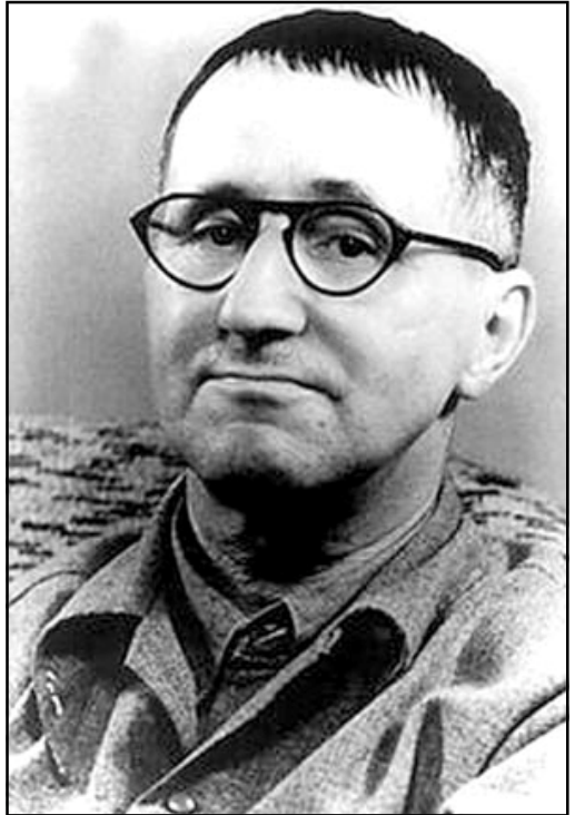
El 14 de agosto se cumplieron 50 años de la muerte del dramaturgo, poeta y comunista alemán, Bertolt Brecht.

del homenaje, portando uno tras otro sus abollados baldes llenos del líquido negro, se encaminaron todos a la ciénaga, y allí lo derramaron.