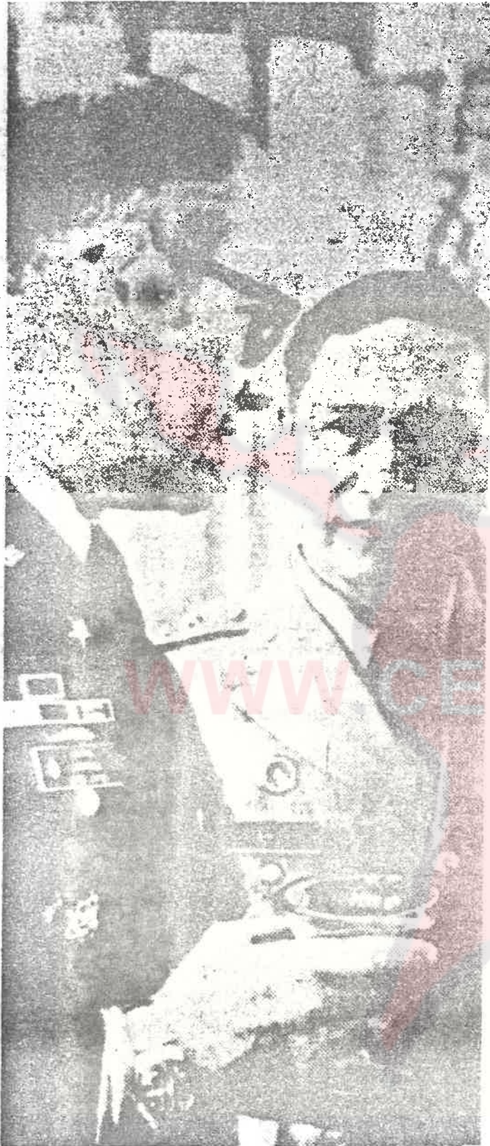
El Coronel Norteamericano Eldom Cummings y el General, Guillermo García Ministro de Defensa de El Salvador, brindan al concluir la salvaje matanza de Morazán, donde perecieron cerca de 1,000 personas.

correspondido conocer o presenciar de la guerra revolucionaria!