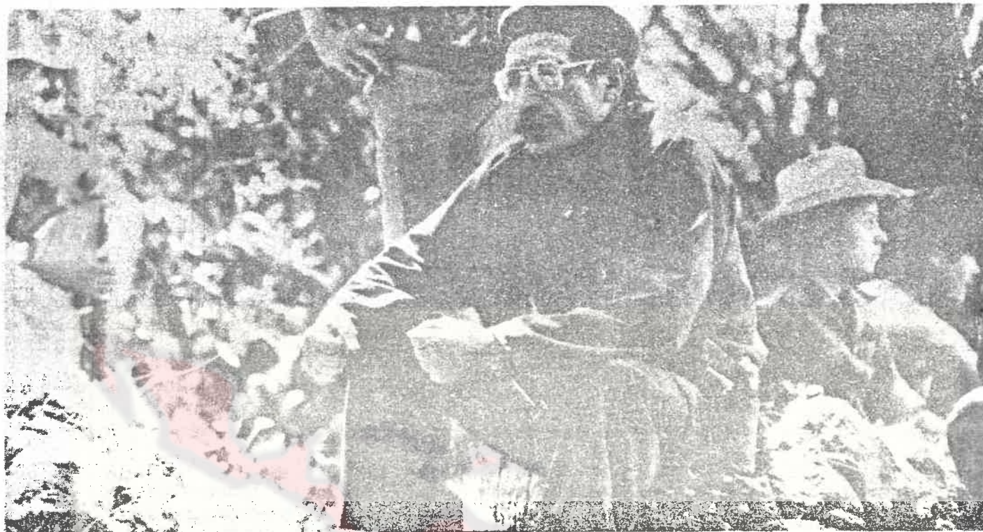
Más de 30.000 habitantes civiles, especialmente niños, mujeres y ancianos han sido masacrados por los militares con la complicidad de los dirigentes demócrata-cristianos reaccionarios de El Salvador.