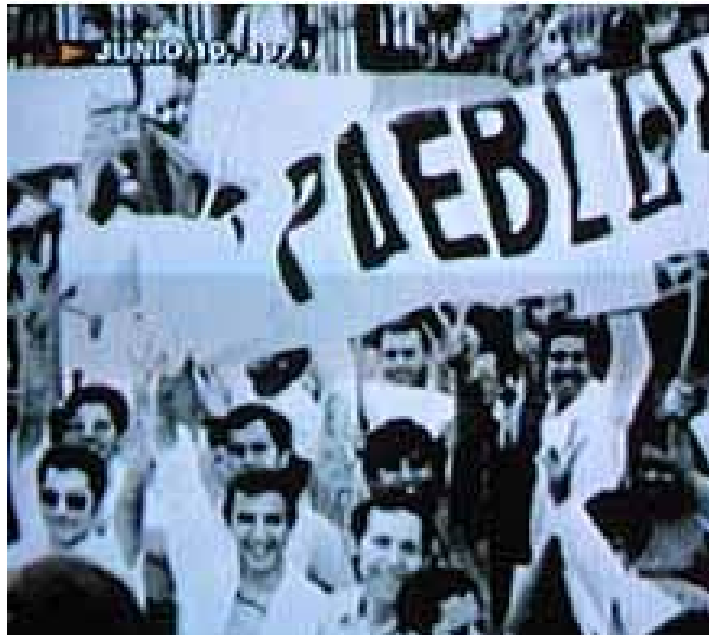
2 de octubre ¡NI PERDON, NI OLVIDO!

A cuatro décadas de la masacre del 68 el crimen de Estado sigue en la total impunidad, por eso no se debe quitar el dedo del renglón y la exigencia de justicia sigue siendo una demanda legítima y una bandera de lucha que no se debe abandonar ni desvirtuar. En estos momentos la exigencia es no permitir que sigan cometiendo crímenes de lesa humanidad como las masacres por motivos políticos y las desapariciones forzadas por motivos también políticos. ¡NI PERDON, NI OLVIDO!.