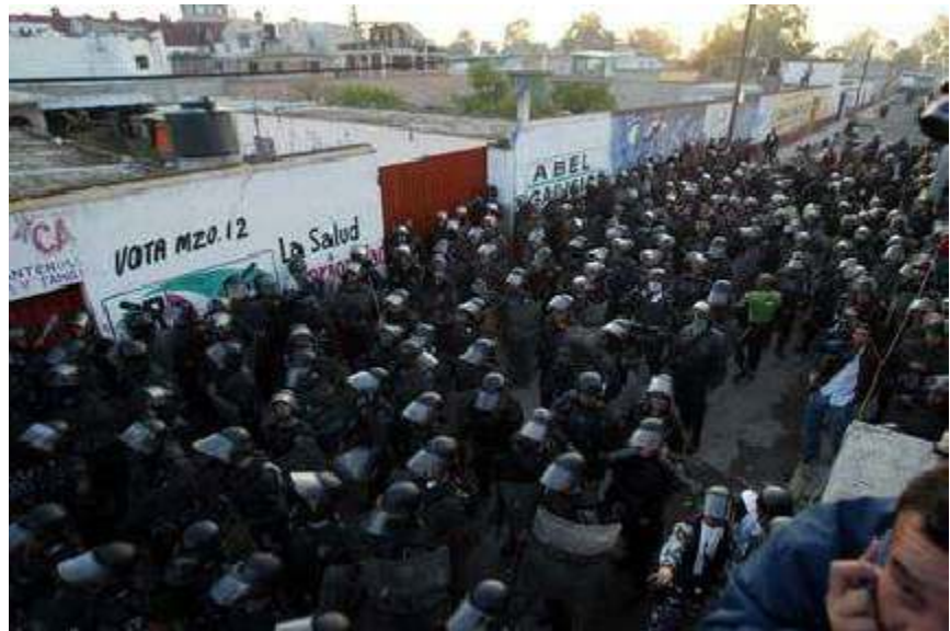
FUERZAS REPRESIVAS CONTRA EL PUEBLO DE SAN SALVADOR ATENCO

La indignación y la rabia que esto genera en la gente sensible ante las injusticias sociales por ratos se torna insoportable, estoy seguro que al igual que yo muchos quisiéramos