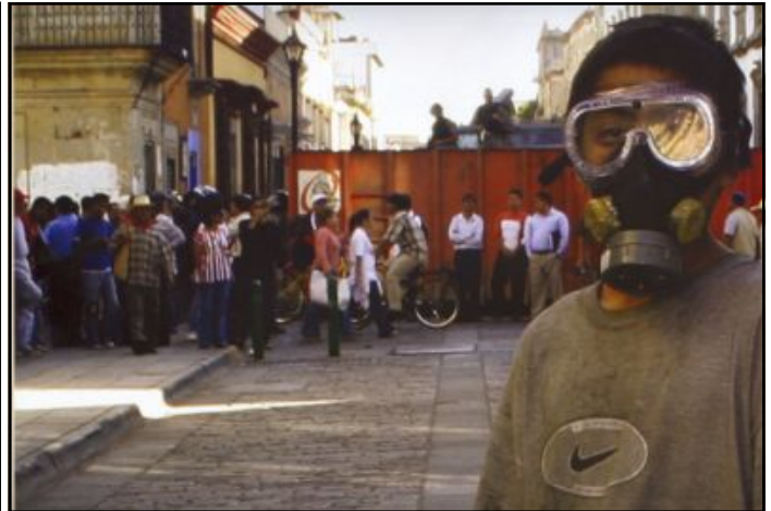
Foto: Jorge Luis Santiago. Tomada del calendario 2008, Oaxaca: de cara a la nación (Colibrí Colectivo Libertario).

Por eso estoy ahora con una cuerda en el pescuezo, con un fusil en las entrañas, dando de alaridos, manotazos y patadas, para volver otra vez a luchar, a fracasar, volver a luchar,