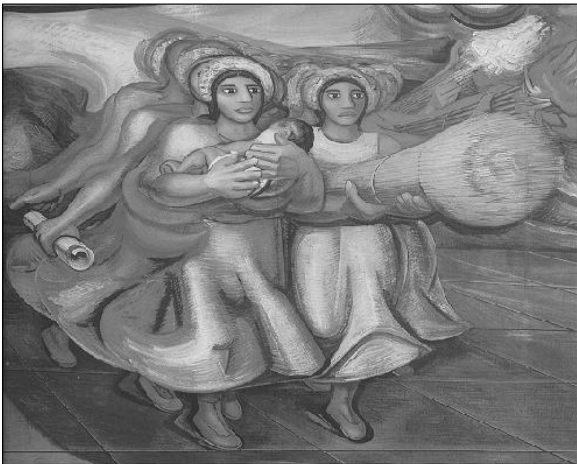
8 de Marzo día internacional de la mujer Detalle de un mural de David Alfaro Siqueiros