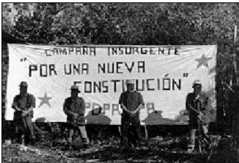
COMBATIENTES DEL EPR

La historia de lucha de los pueblos nos ha dejado la enseñanza de que las clases que detentan el poder nunca han estado dispuestas a dejar pacíficamente