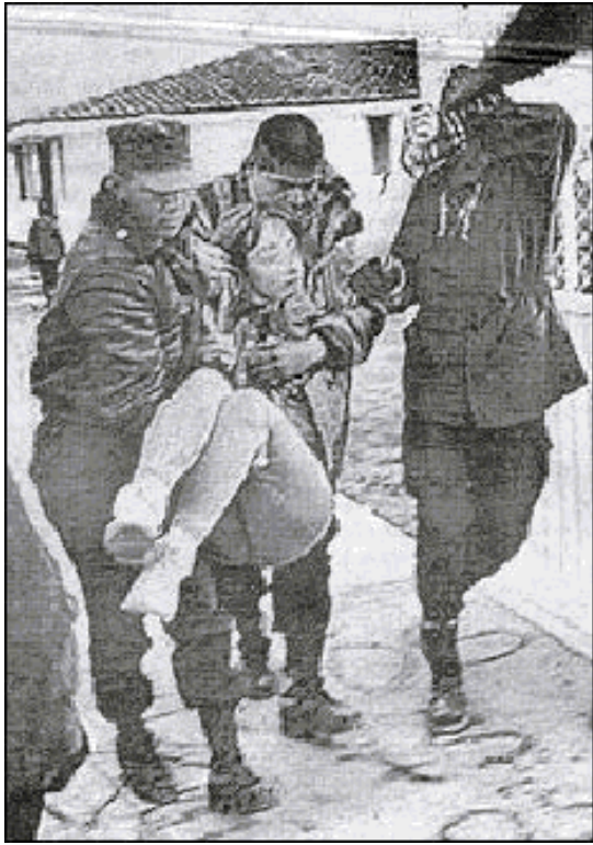
Expulsión de observadores extranjeros de México

Ante esta realidad, la simpatía y solidaridad hacia la lucha justa del pueblo mexicano por parte de la comunidad internacional no se ha hecho esperar. Observadores extranjeros y organizaciones de derechos humanos han manifestado su indignación y protesta por la represión y masacres cometidas en contra del pueblo como las de Aguas Blancas en Guerrero, los Loxicha en Oaxaca y por los múltiples casos de asesinato, tortura, encarcelamiento y desaparición forzada de luchadores sociales en todo el país; y más recientemente por los acontecimientos de Acteal y Ocosingo, en Chiapas.