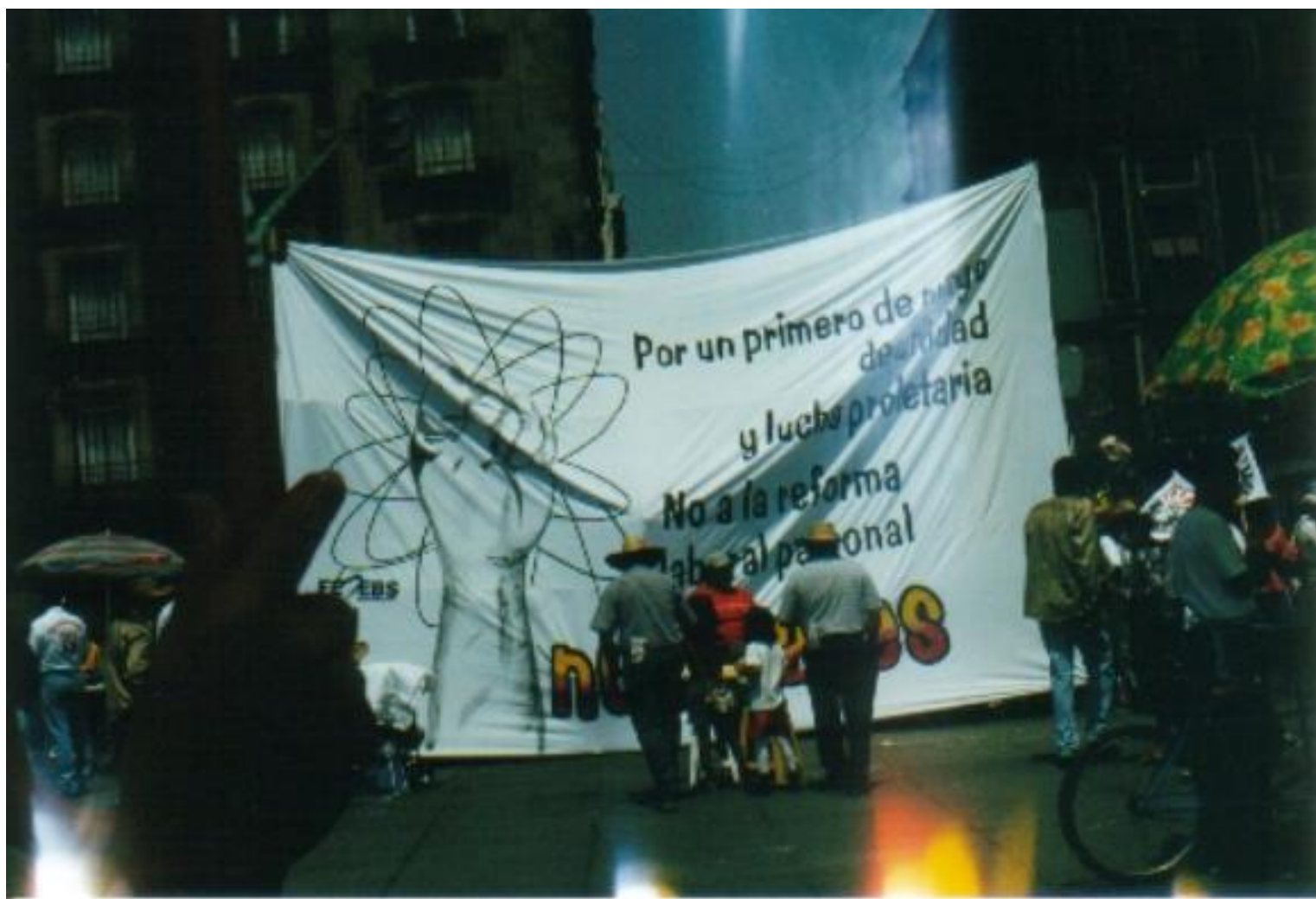
A impulsar la lucha unidad y la lucha política del movimiento obrero

En el ámbito internacional se impide la organización y la lucha de la clase trabajadora por los gobiernos y las transnacionales de manera más coercitiva, aplicando medidas y métodos de presión fascista en el que se coartan y violan no sólo los derechos laborales, sino también los derechos humanos.