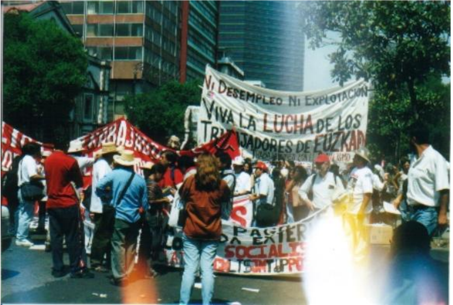
La protesta de los obreros este Primero de mayo en la Cd. De México.

A partir de la Revolución Industrial, donde los obreros fueron sistemáticamente reemplazados por las máquinas, el hombre viene luchando por mejores condiciones laborales, y a lo largo de arduas y sangrientas luchas ha conseguido logros para clase trabajadora, como el poder pertenecer a un sindicato, jornadas diarias de 8 horas de trabajo, contar con servicio médico, incapacidades por accidente o enfermedades, obtener indemnizaciones y jubilaciones, en el mejor de los casos días de descanso semanal y vacaciones pagadas.